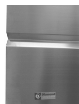
Frontale con logo