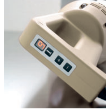
Regolatore a 9 velocità con display luminoso Luminous display with 9 speeds regulator

FSP Supporto pentola regolabile e con snodo libero Adjustable pot support with free articulated joint