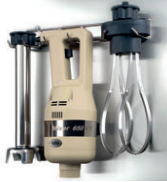
FSPC Supporto parete Wall support