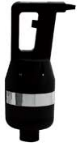
MIXER 650 VV

La tecnologia SRS consente di ottenere composti estremamente omogenei. SRS device grants high-quality homogeneous mixtures.