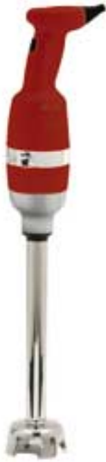
MIXER 400 VV

STICK BLENDERS LIGHT DUTY LINE variable speed