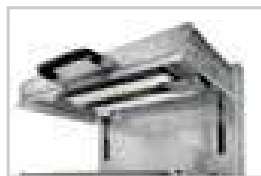
Gaz forte puissance / High power gas