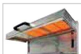
Vitrocéramique / Glass ceramic