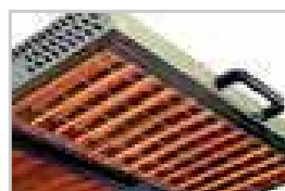
Quartz infrarouges / Infrared quartz tubes (1050°C)