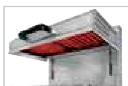
Résistances blindées / Metal heating elements