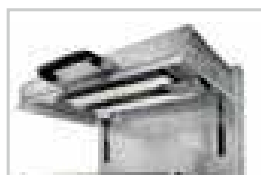
Gaz forte puissance / High power gas